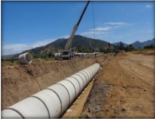
Montaje de tubos prefabricados.