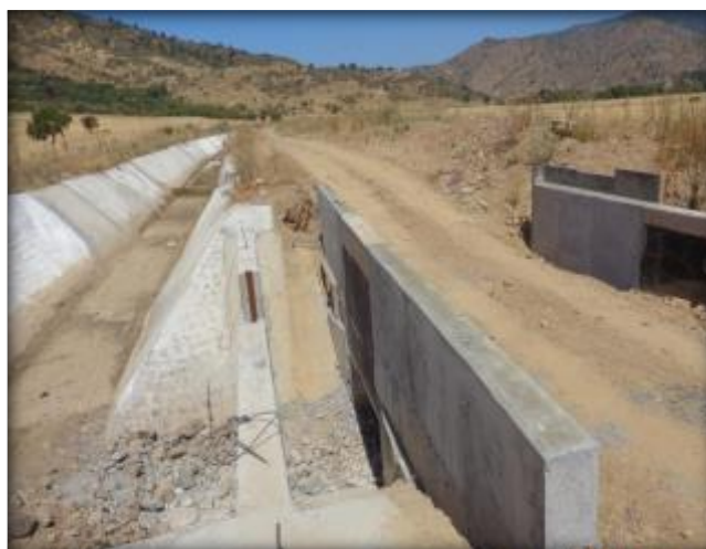
Construcción cruce quebrada CQ6, Km 2,720.