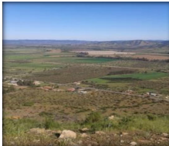
Vista panorámica del valle en Lolol, que será regado por los canales del proyecto.