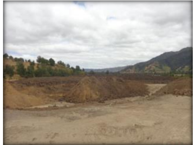
Movimiento de tierras.