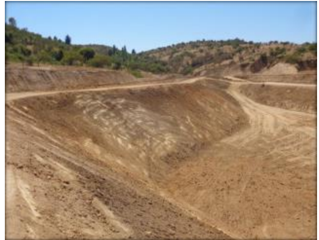
Corte de talud.