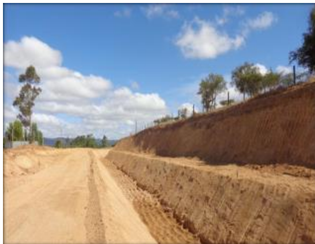
Corte de canal, Km 39,160.