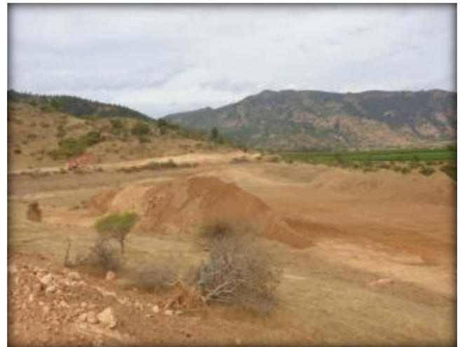
Movimiento de tierras.