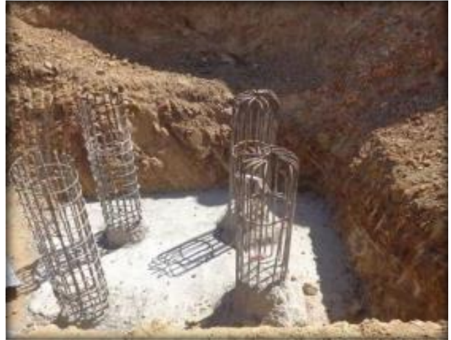
Pilotes de amarre, sifón, llegada a camino, Km 0,026.