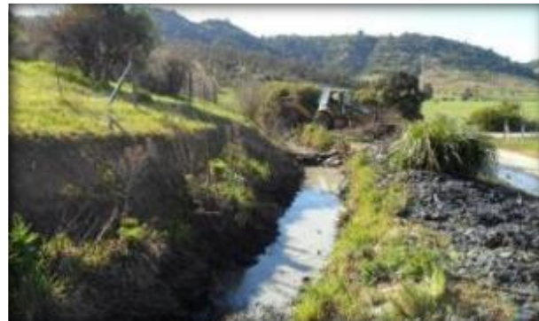
Sector de Canal Panamá Primario.

A partir del Canal Primario, se deriva el Canal Panamá Secundario, que se construirá en esta etapa, con un caudal de diseño establecido en el proyecto de la red primaria de 998 l/s, previsto para regar una superficie de 998 ha, con una longitud de 5.982 m. Será excavado en tierra sin revestimiento.