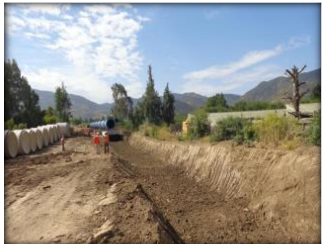
Excavación para tubería, Km 0,100.