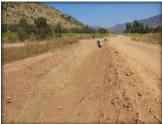
Corte de canal, Km 16,150.