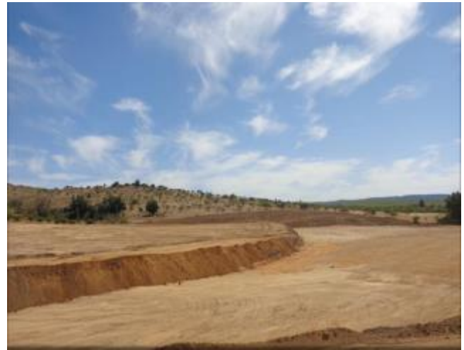
Movimiento de tierras.