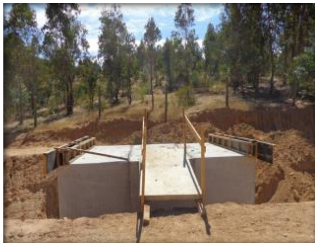
Construcción de paso predial, Km 22,270.