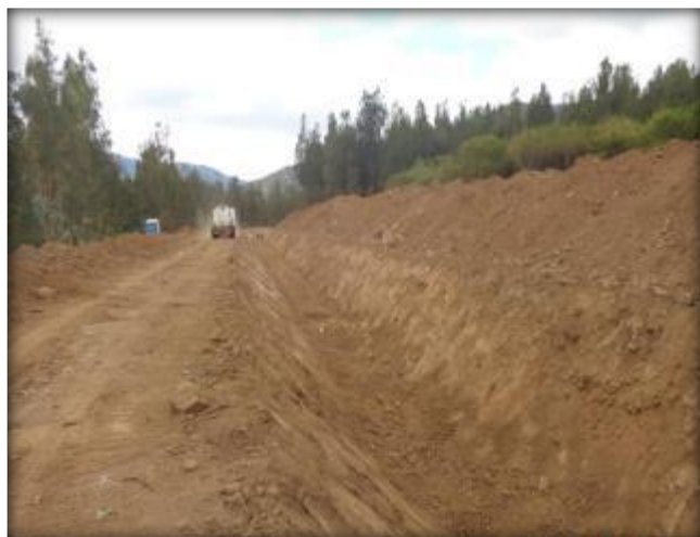
Sello de fundación para hormigonado de radier, Km 0,100.