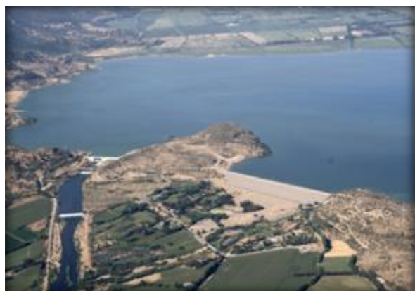
Zona de Presa y Embalse Convento Viejo.