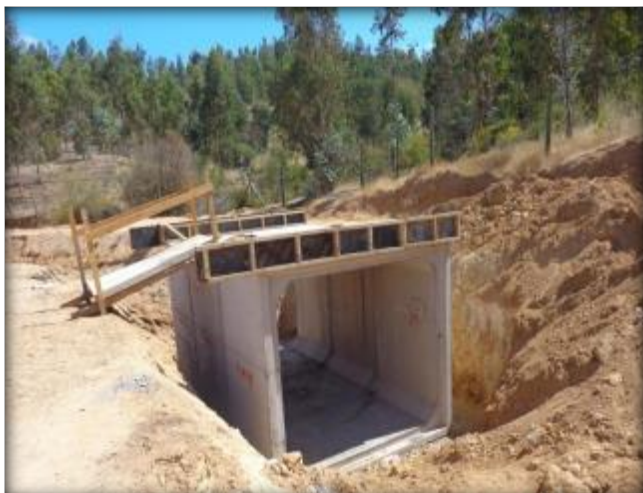
Construcción de paso predial, Km 22,270.