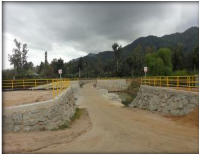
Vista panorámica Bocatoma Canal Lolol Sur.

Los recursos de este canal permitirán regar los sectores de Pastizales, Lolol Bajo, El Peumo, La Palma, Monterina Baja, Tres Esquinas, Vaticano, Portezuelo y El Guaiquillo.