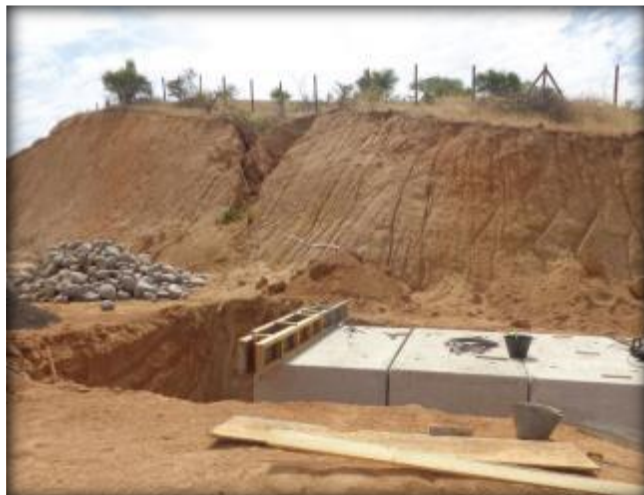
Construcción de paso predial, Km 31,740.