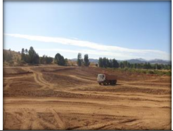
Movimiento de tierras.