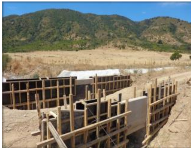
Construcción cruce de quebrada CQ6, Km 2,720.