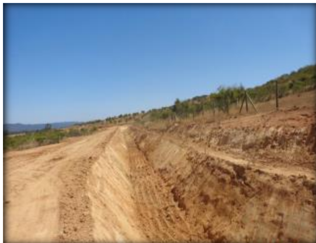
Corte de canal, Km 39,460.