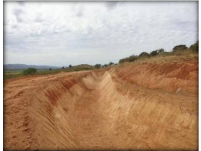
Corte de terreno, Km 19,450.