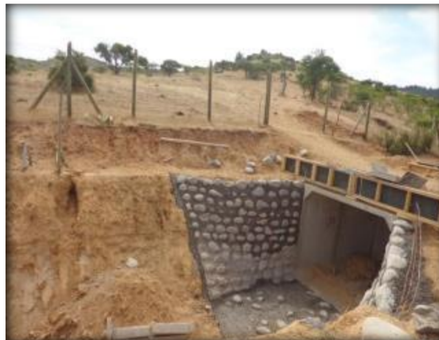
Mampostería para paso predial, Km 30,780.