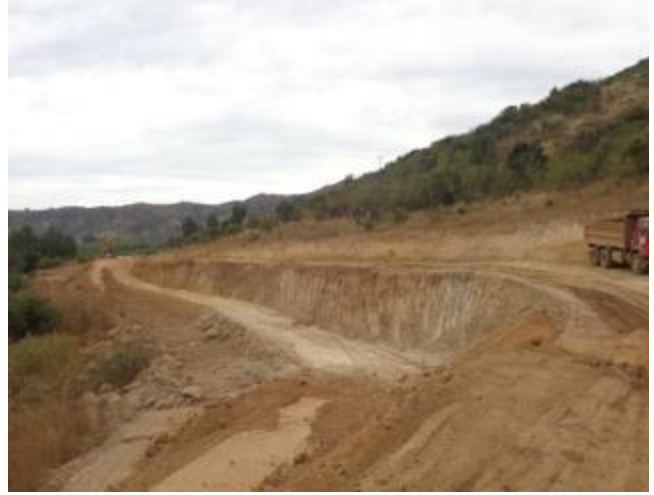
Construcción de terraplén, Km 17,000 .