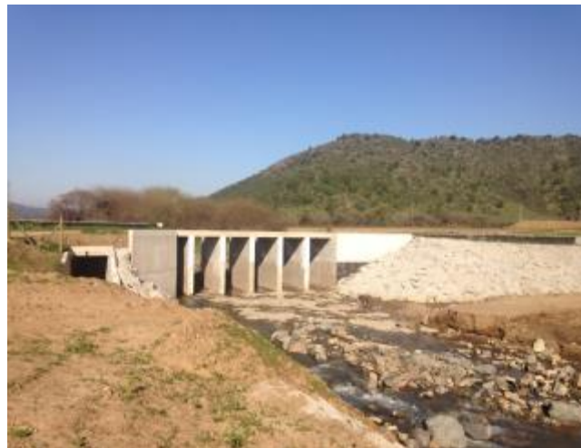
Bocatoma Canal Norte Unificado, barrera frontal.