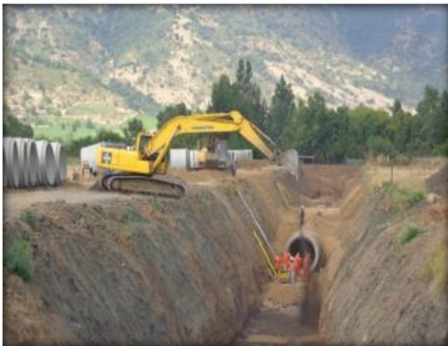
Preparación sello de fundación , Km 0,950.