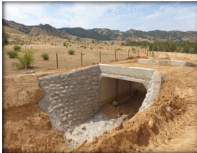
Construcción de paso predial, Km 29,320.