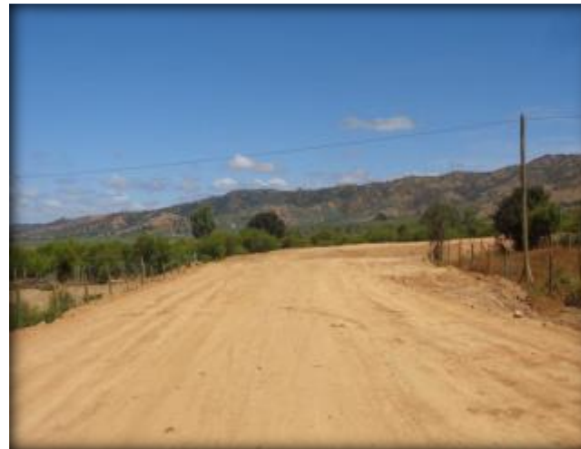
Construcción de terraplén, Km 16,700.