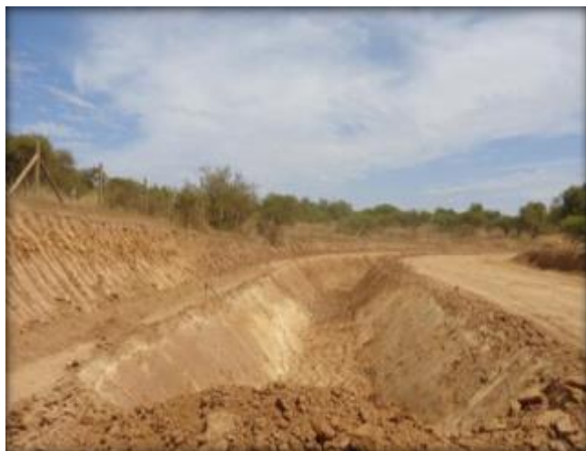
Corte de canal, Km 38,300.