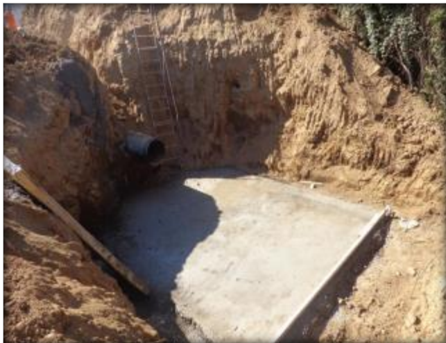
Emplantillado para cruce de quebrada CQ6, Km 6,150.