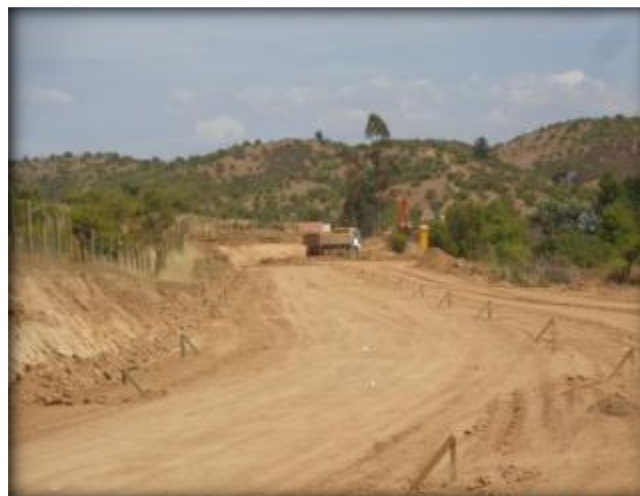
Plataforma para corte de canal, Km 39,940.