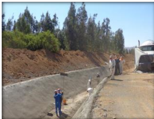
Hormigonado de radier, Km 0,120.