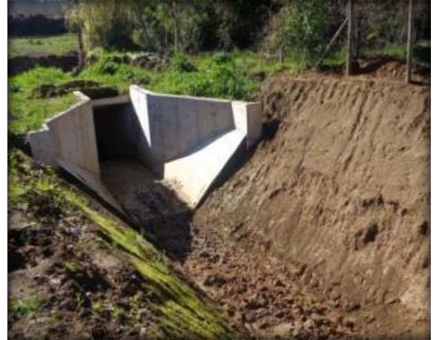
Cámara de salida de Sifón Fortaleza.

Esta obra permite dar continuidad al Canal Lolol Sur y se ubica entre el Km 0.850 y el km 0.925 de éste. Se proyecta en 75 m de largo y en un diámetro de 1,85 m en acero, para cruzar el Estero Fortaleza.