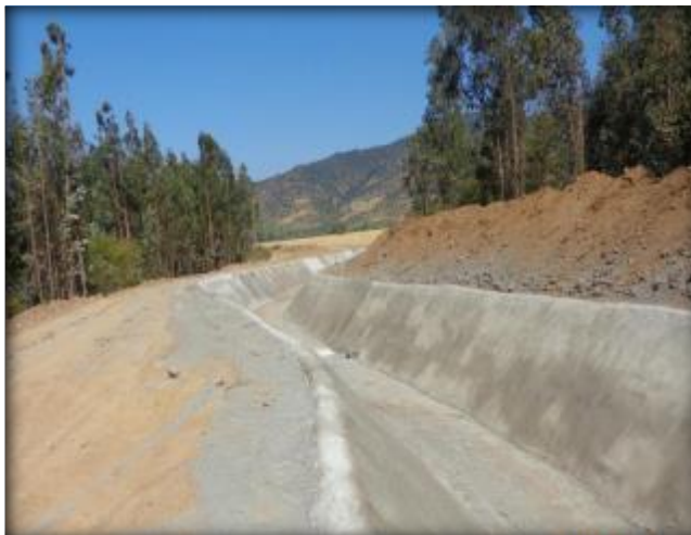
Hormigonado de canal, Km 2,700.