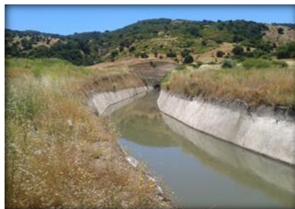
Sector de salida poniente Túnel La Lajuela.