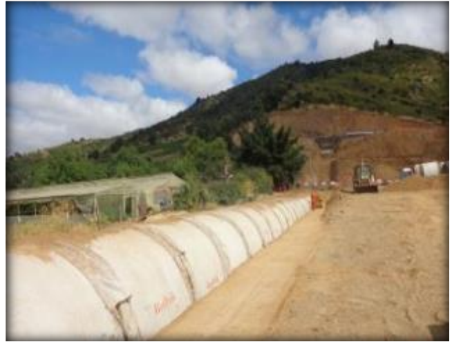
Relleno estructural para tubería.