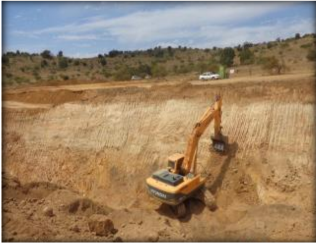
Corte en terreno, Km 20,600.