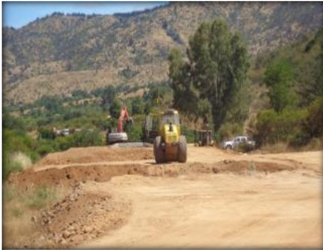
Construcción de terraplén, Km 16,850.