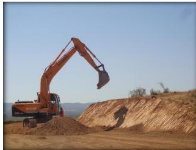
Corte de terreno, Km 19,900.