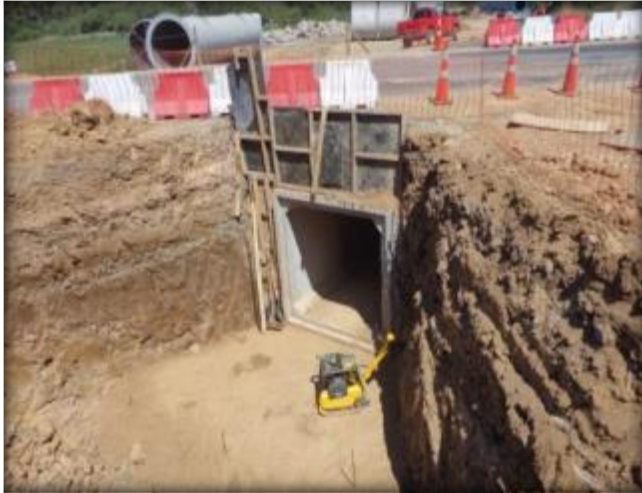
Sello de fundación para cajón prefabricado, Ruta I-72.