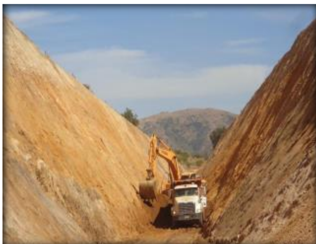
Corte de terreno, Km 20,900.